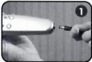
1. 把變壓器的電源輸出接頭插入雷射健髮梳。

我們建議雷射健髮梳使用在洗淨的頭皮上。你的頭髮可以是溼的、吹風機吹乾的或是用毛巾擦乾的。雷射健髮梳應該在使用任何作用在頭皮上的髮膠、外用生髮水、噴髮膠或是噴霧假髮類產品前使用。