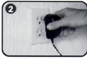
2. 把變壓器插頭插入牆上的插座。