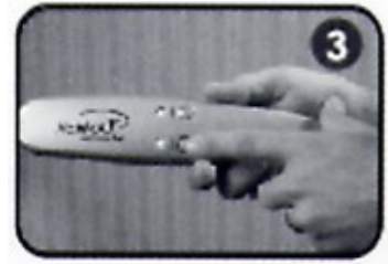
3. 按"Power"鈕一次,然後按"Laser"鈕一次已啟動健髮梳。